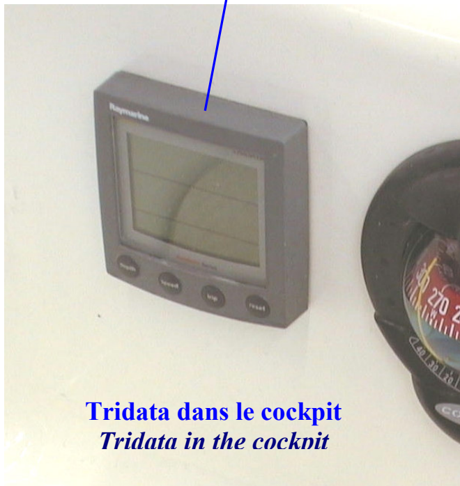
Tridata dans le cockpit Tridata in the cockpit